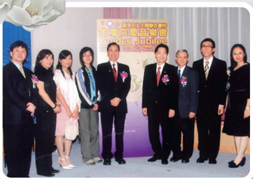
張博士（右四）出席聯合書院金禧音樂會。