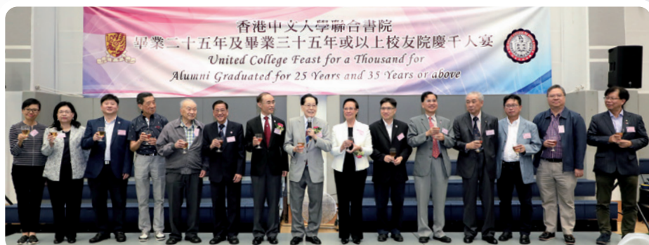
張博士（中）主持校友千人宴祝酒儀式。