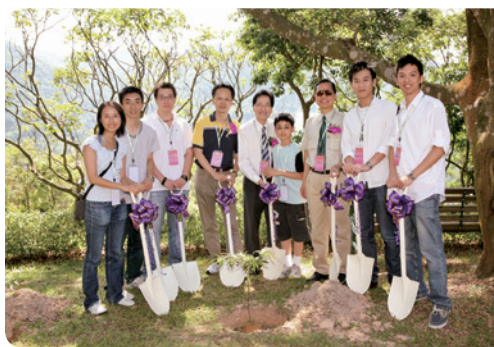
張博士（中）及兒子一同出席校友日植樹活動。

張博士社會地位崇高，然他最受愛戴與敬重的卻是其為人。何師兄謂他從沒架子，所有會議都會準時出席，即使身在外地也會特地坐飛機回港開會。馮教授也笑言：「當校友會會長44年來，除了必到，他更可說是從沒遲到。我們每兩月開一次會，除唯一一次因飛機誤點外，他從沒遲到。44乘6，264次啊！這記錄多難破！我們校友一定要學習他這麼努力去為校友服務、與書院聯繫的心，他退任時我在歡送會上也是這麼說的，一定要學習，這是由衷之言。」